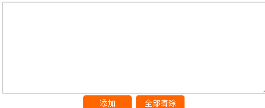
图 7 Web 留言本