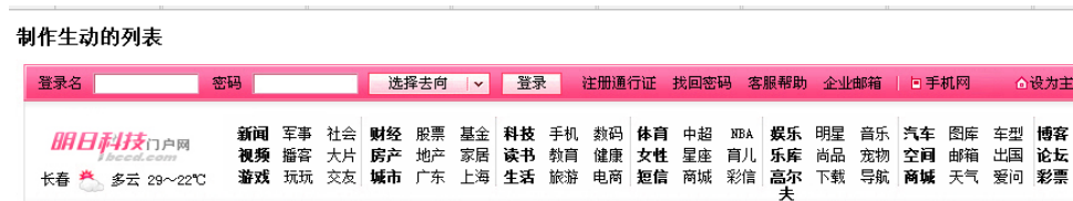
图 9 导航列表

1. 设计导航列表实验，要求使用结构伪类选择器来制作导航列表样式，具体效果如图 9 所示。