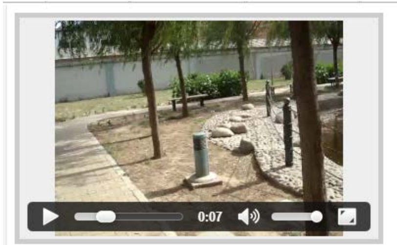
图 6 显示媒体文件播放时间