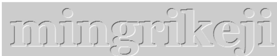
图 10 立体文本效果

2. 设计立体文本实验，要求使用 text-shadow 属性给字体指定多个阴影，并且针对每个阴影使用不同的颜色，具体效果如图 10 所示。