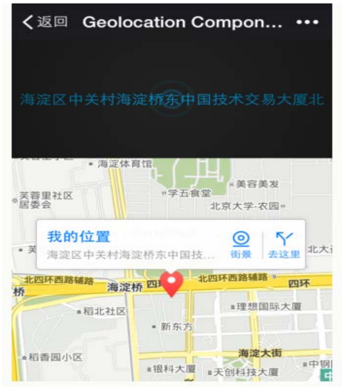
图 8 离线地图