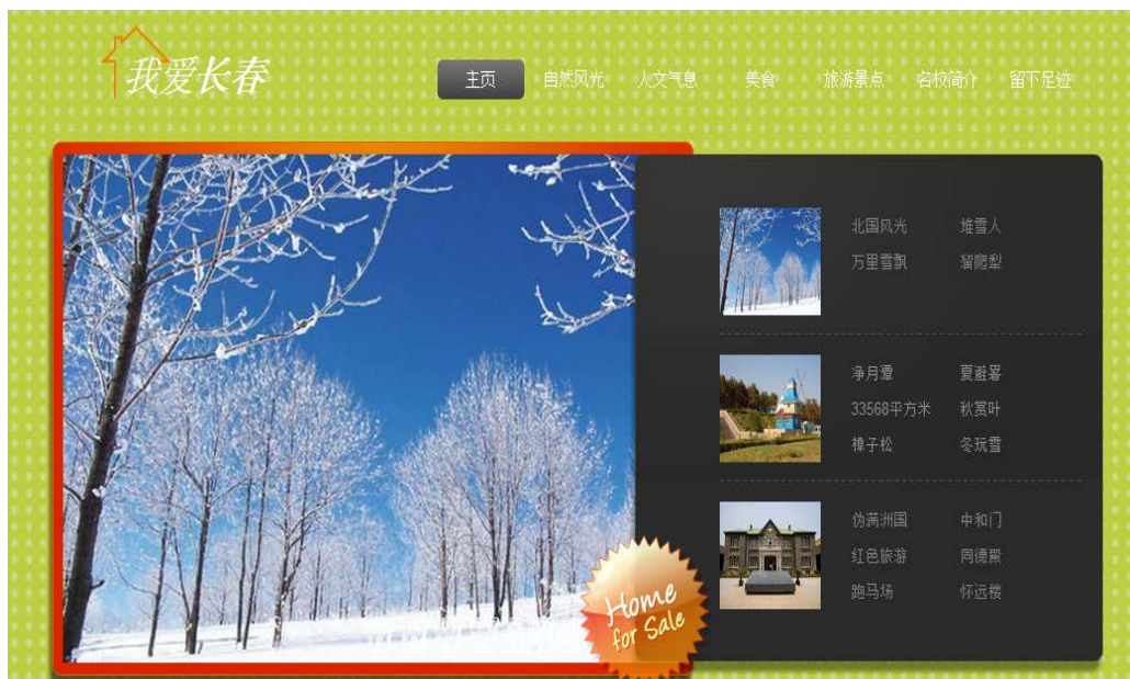
图 12 旅游信息网

设计综合实验，旅游信息网前台，该网站包括主页、自然风光页、人文气息页、美食页、旅游景点页、名校简介及留下足迹页等页面，要求综合采用 html5 元素、css3 样式元素和 JavaScript 结合完成，系统目标是：操作简单方便、界面简洁美观、通过便签方便的记录用户的计划、系统运行稳定、安全可靠。主要页面如图 12 所示。