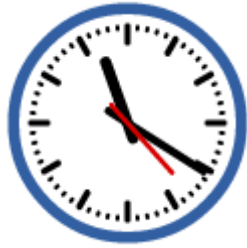
图 5 桌面时钟

rotate; 轮廓边框样式 strokeStyle、填充样式 fillStyle、画线方法 moveTo、lineTo、画圆形方法 arc、动画 setInterval 方法等。