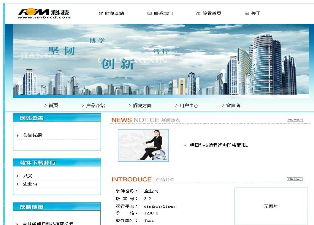
图 11 企业门户网站

3. 设计企业门户首页实验，要求使用 css3 设置背景的属性来设置不同的背景，设置边框的属性来添加边框，具体效果如图 11 所示。